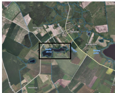
3 pav. Obelių ežeras

Žaliajam turizmui plėtoti dvaras galėtų būti pritaikytas dėl gausių gamtos išteklių, kuriuos sudaro dvaro parkas, tvenkiniai, šalia dvaro tekanti Šventosios upė.