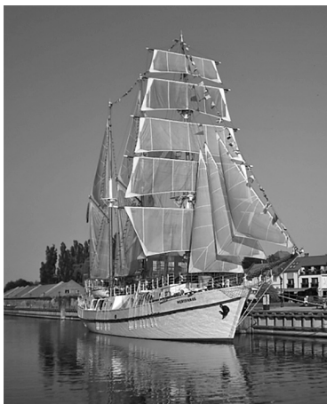
2 pav. Klaipėdos miesto simbolis – burinis laivas „Meridianas“

pagarba svarbiems Klaipėdos krašto veikėjams, gyvenusiems, kūrusiems, kovojusiems už Lietuvą ir jos piliečius. Iš dešimties atminimo lentų tik viena yra skirta jūrininkui ir atitinka jūrinę dvasią. Tai atminimo lenta Liudvikui Stulpinui – pirmajam Lietuvos jūrų kapitonui – pagerbti (Klaipėdos turizmo ir kultūros informacijos centras, 2021). Klaipėdoje Liudvikui Stulpinui taip pat yra pastatytas ir skulptūrinis biustas (Sankryžos g. 7).