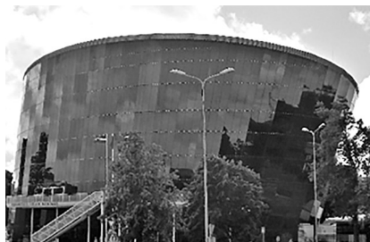
1 pav. Liepojas koncertu salē „Lielais dzintars“