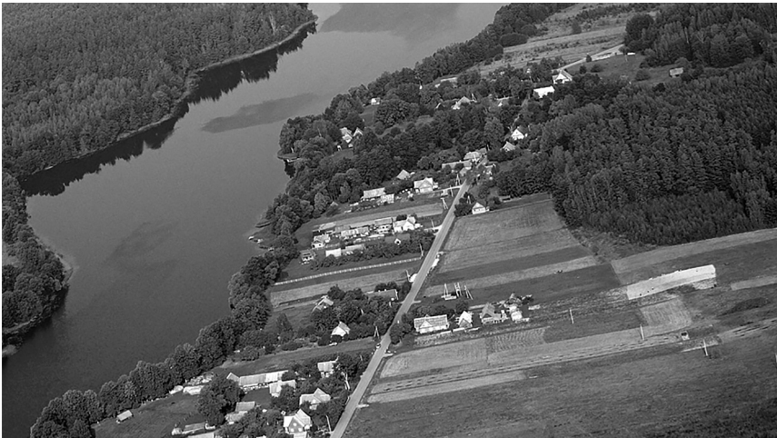
1 pav. Meironių kaimo kraštovaizdžio ypatumai

Meironių kaimas yra nuostabioje Aukštaitijos nacionalinio parko vietovėje, į vakarus nuo Palūšės, prie Lūšių ir Asalnų ežerų. Tai nedidelis, tipiškas gatvinis kaimelis (1 pav.). Kaimo gyventojai užsiima ne vien tik tradicine žemės ūkio veikla ar žuvininkyste, bet ir plėtoja privatų rekreacijos verslą.