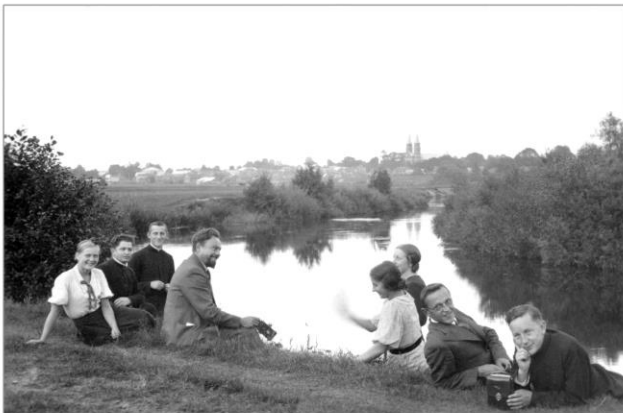
Prof. Kazys Pakštas su biėnūlais ant Šventosios upės kranto ties Užpaliais

Lietuvos geografų draugija kasmet kviečia geriau pažinti LGD įkūrėjo prof. Kazio Pakšto gimtąjį kraštą. Šiltą ir giedrą gegužės 13 d. vakarą, prie švento Krokulės (Lygamiškio) šaltinio, susirinko būrys besidominčių Užpalių krašto gamtos ir tradicijų puoselėjimu. Ši Sekminių savaitgalį tyrinėjome magiškomis galiomis garsėjantį Krokulės šaltinį.